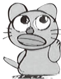
みすずイメージキャラクター「すずちゃん」

【就労継続支援B型事業所】障がい者総合支援法に基づき、障がいのある方が仕事を通じて、自立と社会活動への参加を促進する事を目的に、就労に必要な知識及び能力の向上のために必要な訓練を行います。